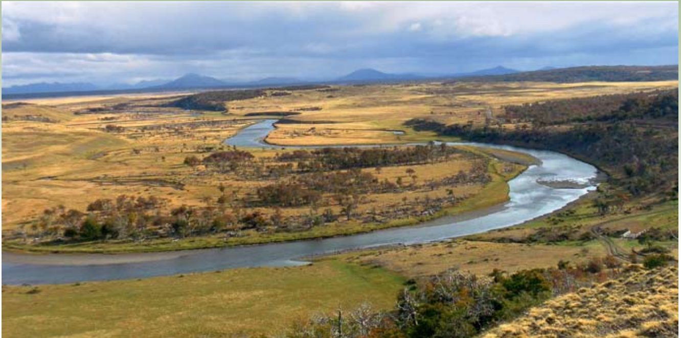
Značilna pokrajina ob gornjem toku reke Rio Grande

Na Ognjeno zemljo so potočno postrv prinesli okoli leta 1930. Izvor iker je bil iz nekaj različnih virov, med drugim tudi z Danske. Razmere so jim prijale in že po nekaj letih so imeli odličen ribolov. V nekaj rekah so se pojavile tudi postrvi selivke. Kot je videti, so to postrvi danskega izvora, ki so v bistvu morske postrvi. Rast enih in drugih je bila hitra in ribe so dosegale bistveno večje velikosti kot njihovi predniki v domovini in tako je še dandanes.