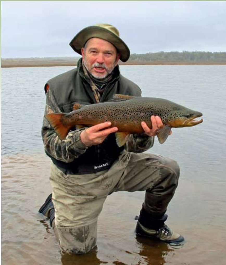
Lagune - majhna in plitka jezera, raztresena po Ognjeni zemlji, so domovanje izjemno velikih potočnic.