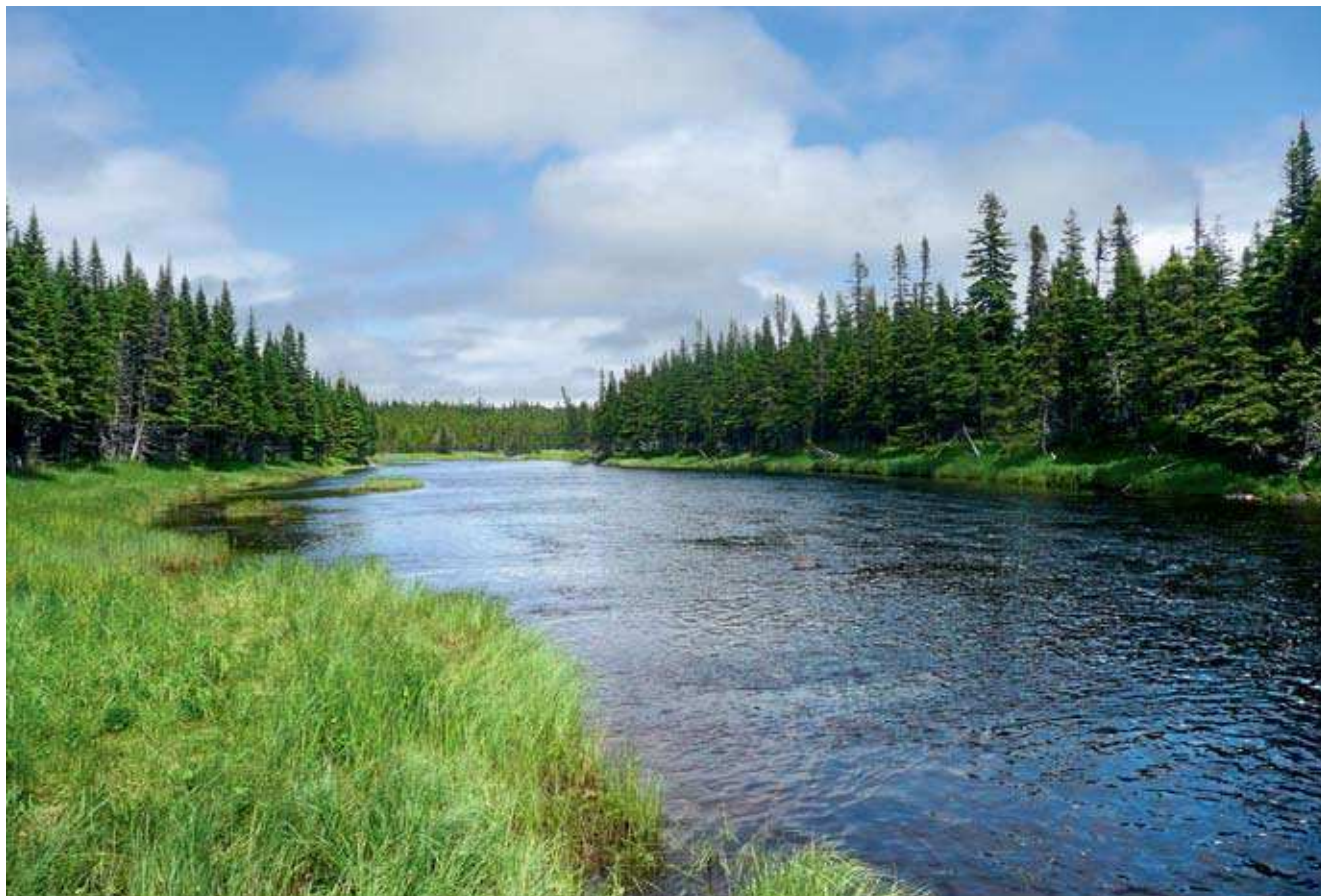
The Salmon river – Lososova reka

Kanada je zaradi drastičnega zmanjšanja ribjega fonda v morju leta 1990 pre-