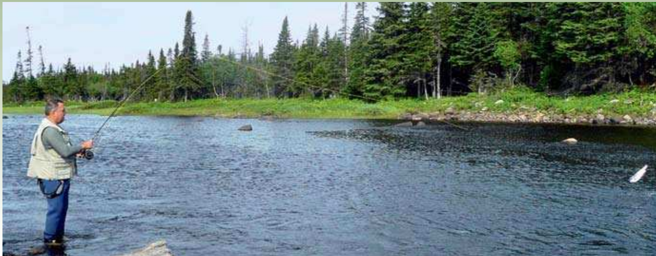
Lososov akrobatski skok v zrak. Veliko užitka, a tudi malo tesnobe, saj se največkrat sname prav v skoku. Nič zato, kmalu bo prijel naslednji ...

povedala komercialni ribolov v pasu 200 milj ob svoji atlantski obali. Prizadetim profesionalnim ribičem je zagotovila rento in prekvalifikacijo. Večina od njih so postali vodniki za ribolov in lov. Stanje ribjih populacij v morju se je hitro začelo izboljševati. Na bolje je šlo tudi z atlantskim lososom. V rekah atlantskih provinc Kanade (New Brunswick z reko Miramichi, Nova Fundlandija in Labrador), a tudi Quebeca je dandanes ribolov na atlantskega lososa pomemben dejavnik turistične ponudbe. Tako sta zdaj provinci Nova Fundlandija in Labrador verjetno najboljše območje za lov te, med športnimi ribiči izjemno cenjene ribe. Od celotnega števila rek z lososom na ameriški celinici jih temu območju pripada polnih 40 odstotkov.