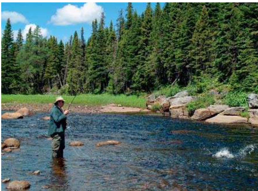
Tudi manjši losos je izjemen borec.

Kot sem že omenil, je v reki veliko atlantskih lososov in po mojih izkušnjah se število še večja. Glavnina so t. i. grilse . To so lososi, ki se že po enem letu življenja v oceanu vračajo v sladko vodo; pa ne na drst, kajti večina jih še ni spolno zrela. Velika večina so samci. So pa edina skupina, ki jo je mogoče upleniti. Poleg najmanjše mere 40 cm imajo za-