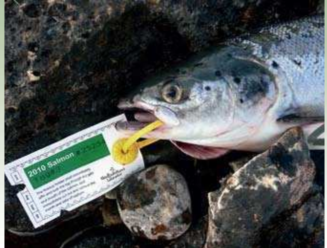
Ob nakupu ribolovnice prejmeš tudi šest plastičnih značk, s katerimi je treba označiti vsakega uplenjenega lososa, preden ga odneseš od vode. Kazni za nespoštovanje predpisov so visoke.