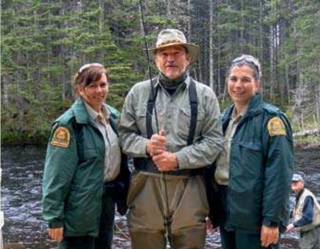
V Kanadi je enakopravnost spolov na visoki ravni. Nič nenavadnega ni, če vas pri ribolovu kontrolira prijetno dekle v službeni uniformi ribiškega čuvaja.